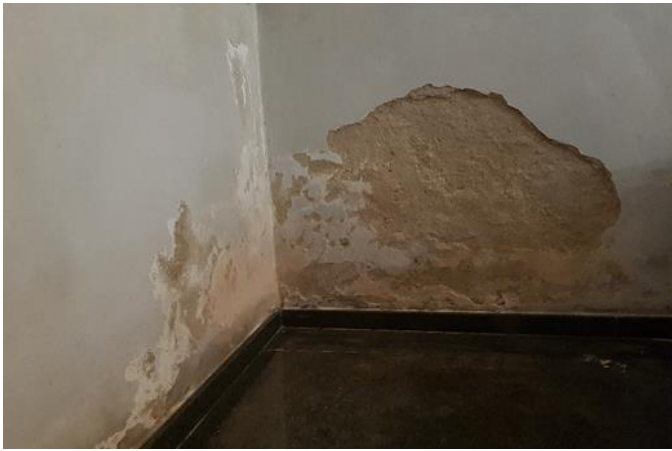
Fot. 3. Fragment narożnika pld.-wsch. kaplicy. Usunięcie lokalnie zasolonych i odspojonych tynków, konsolidacja.