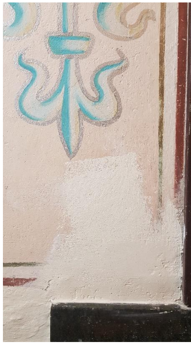
Fot. 7. Fragment dekoracji figuralnej z podłuczca ściany tęczowej. W trakcie oczyszczania z zabrudzeń, podklejania odspojień, uzupełniania ubytków tynku.