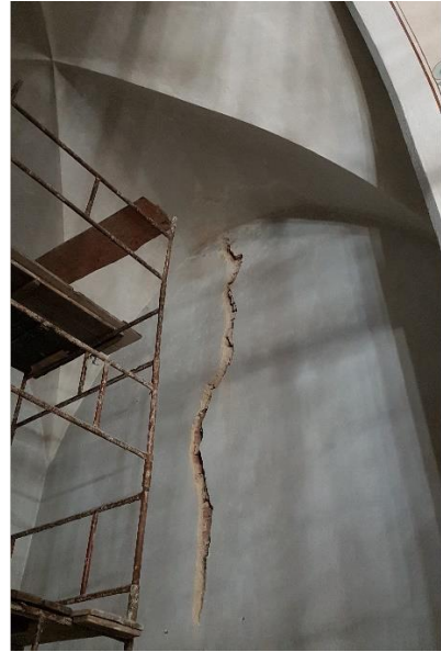
Fot. 4. Fragment ściany zachodniej kaplicy. W trakcie uzupełniania spękania.