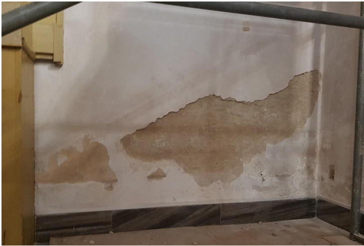
Fot. 1 Fragment ściany wschodniej prezbiterium. Usunięcie lokalnie zasolonych i odspojonych tynków.

W ramach zadania zahamowano procesy destrukcji, poprawiono stan techniczny obiektu oraz przywrócono wnętrzem świątyni walory estetyczne oraz harmonię. Odsolono lokalnie ściany, założono miejscowo specjalistyczne, oddychające tynki, uzupełniono liczne ubytki oraz spękania. Całość pomalowano farbami w technologii żolowo-krzemianowej, w kolorze szlachetnej, starej gotyckiej pobiały. Konserwacji poddano również zniszczone malowidła pędzla E. Plucińskiego.