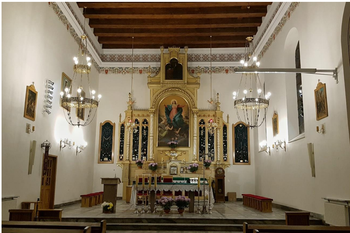
Fot. 9. Widok ogólny na prezbiterium po konserwacji.