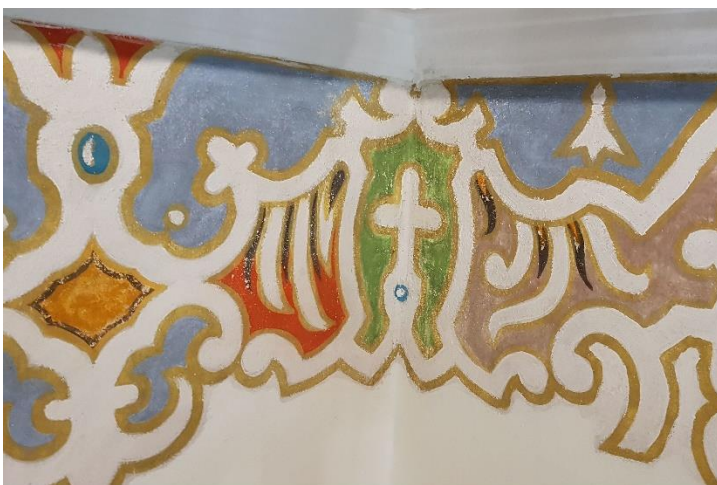
Fot. 6. Fragment dekoracji ornamentalnej. W trakcie oczyszczania z zabrudzeń, podklejania odspojeń.