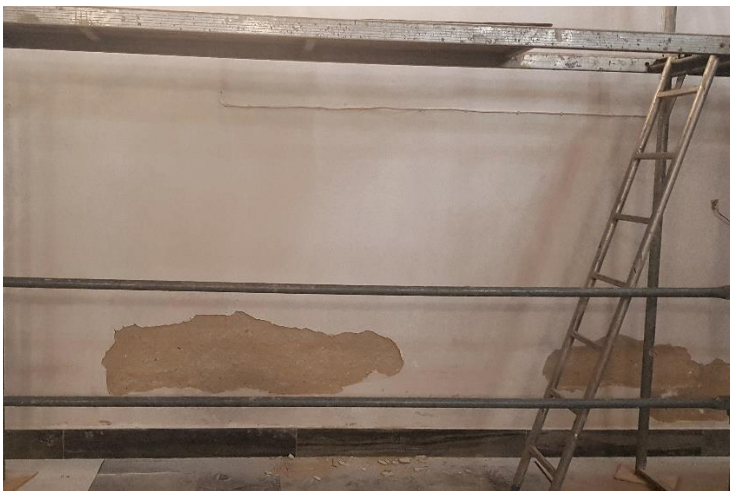
Fot. 2. Fragment ściany południowej prezbiterium. Usunięcie lokalnie zasolonych i odspojonych tynków, konsolidacja, podklejanie osłabionych tynków.