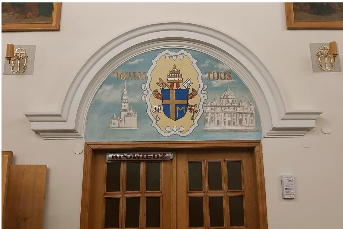
Malowidła na ścianie południowej