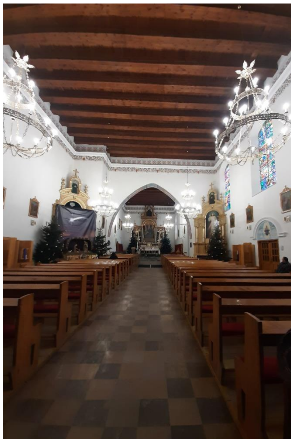
Widok ogólny, ściana wschodnia, prezbiterium