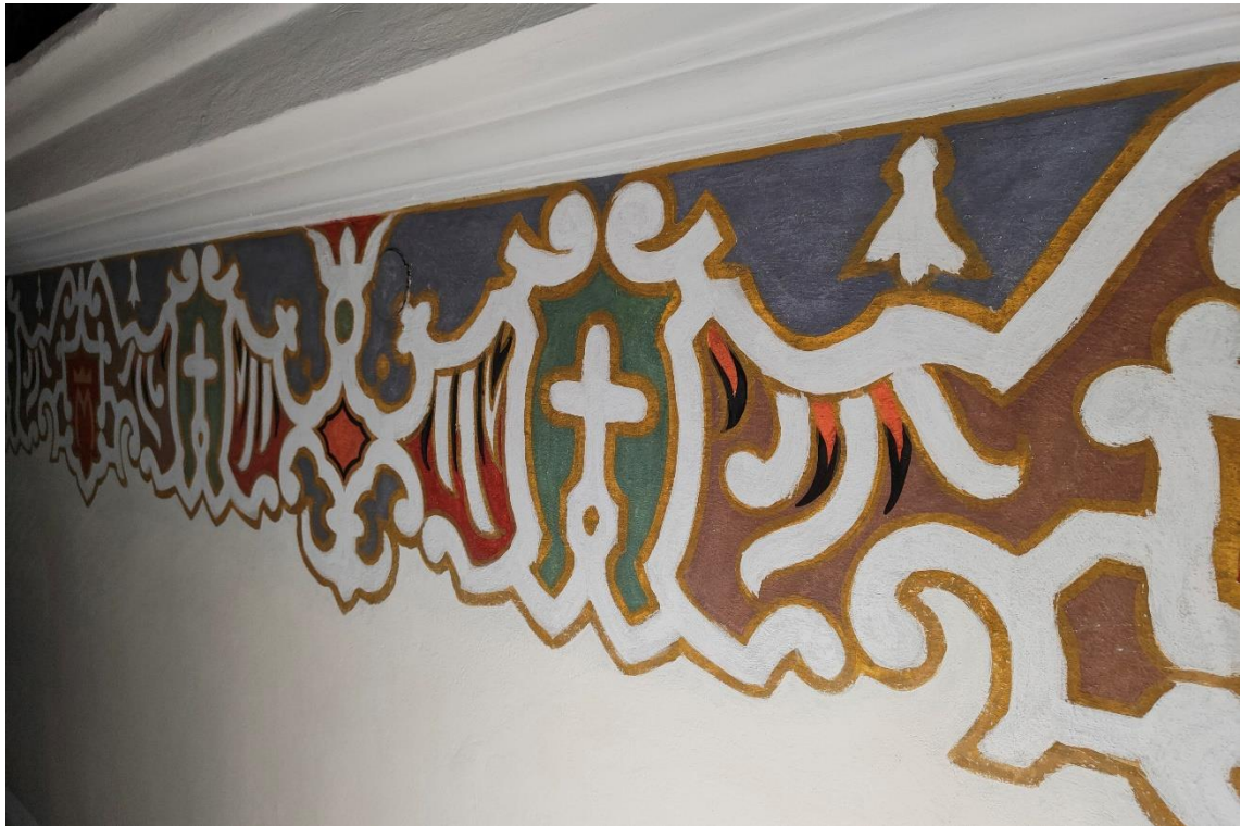
Ornament dolny pół