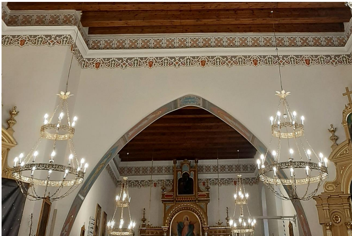
Fragment wnętrza nawy głównej